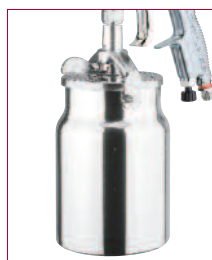
Taza de succión Pieza N° KR-566-1-B

Las pistolas Advance HD están disponibles en estuches con:- pistola de presión solamente, kits de pistola de succión con taza de 1 litro y kits de alimentación por gravedad con taza de gravedad estándar de 568 ml.