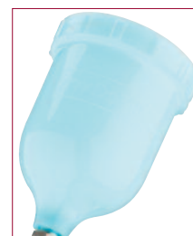
Taza de gravedad (poliéster azul) Pieza N° GFC 511 para fluidos difíciles.