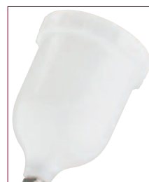
Taza de gravedad Pieza N° GFC 501